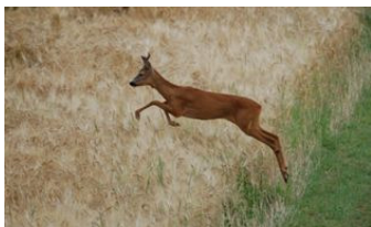
Platz 2: Susanne Gräf