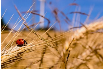
Platz 1: Mirko Mueller