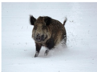
Platz 3: Sandra Scherwinski