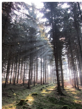
Platz 3: Thomas Müller