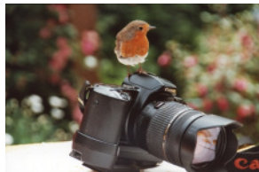
Platz 1: Rolf Goergen